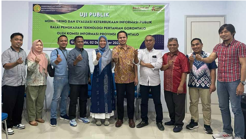
Gambar 6. Pelaksanaan Uji Publik sebagai bagian dari Monev Peningkatan KID Badan Publik Instansi Vertikal TA 2022 Tingkat Provinsi Gorontalo