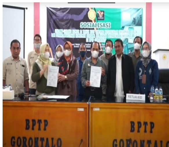
Gambar 1. Sosialisasi UU KIP dan Penandatanganan Komitmen Bersama yang disaksikan oleh Komisi Informasi Daerah dan stakeholder lainnya