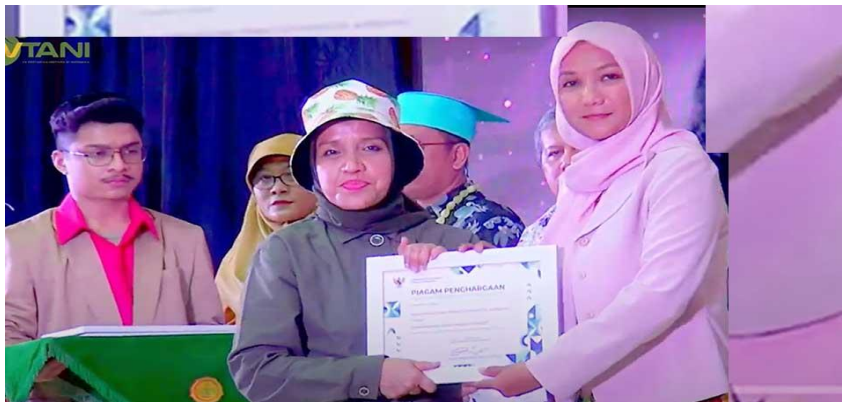
Gambar 9. Penerimaan Anugerah Keterbukaan Informasi Publik Lingkup Kementan dimana BPTP Gorontalo termasuk salah satu yang INFORMATIF

Penganugerahan KIP kali ini dihadiri oleh Menteri Pertanian, Prof. Dr. Syahrul Yasin Limpo, juri evaluator, pimpinan eselon 1, 2 serta eselon 3 UK/UPT yang berhasil lolos dalam penilaian tahap pertama pemeringkatan KIP lingkup Kementerian Pertanian Tahun 2022. Kepala Biro Humas Kementerian Pertanian, Bapak Kuntoro Boga, dalam laporannya menyebutkan kegiatan ini menjadi bagian dari monitoring dan evaluasi atas implementasi KIP sesuai amanah UU No.14 Tahun 2008 di lingkup Kementerian Pertanian. "Pentingnya transparansi dan penderasan informasi publik dengan baik merupakan bagian dari keharusan dalam menyediakan informasi kepada pengguna," tambah beliau. Dengan penganugerahan yang diterima menjadi bukti komitmen BPTP Gorontalo untuk terus berupaya memberikan pelayanan yang transparan dan sepenuh hati kepada masyarakat. Prestasi kali ini menjadi yang ke-2 bagi BPTP Gorontalo setelah sebelumnya di tahun 2021 berhasil masuk di 10 besar Unit Pelaksana Teknis Kategori Informatif lingkup Kementerian Pertanian.