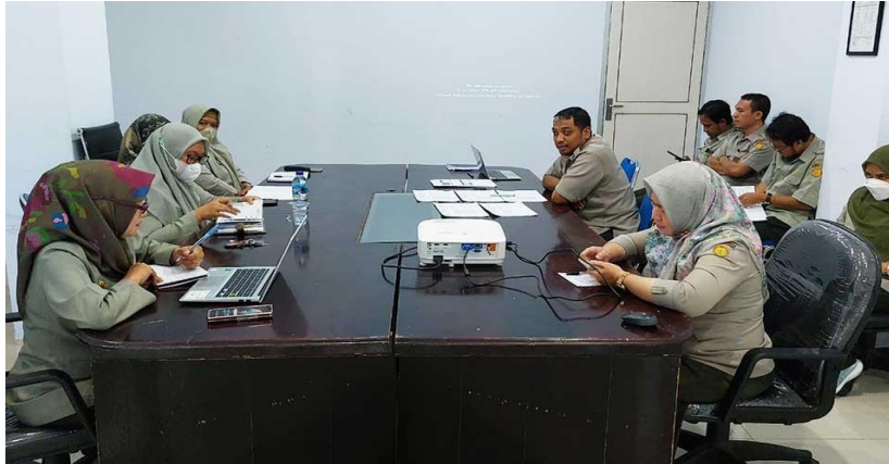
Gambar 2. Pelaksanaan rapat monev kegiatan PPID Semester I Ta 2022

Pelaksanaan Monev KIP/PPID dilaksanakan terpadu pada Monev Kegiatan Balai. Adapun Item permasalahan yang dilaporkan oleh Tim PPID adalah terjadinya serangan siber pada website yang menggunakan domain pertanian.go.id menyebabkan data-data yg sudah diupload di Portal PPID BPTP Gorontalo hilang.