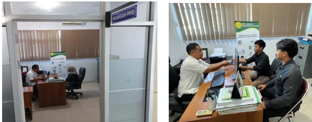
Gambar 7. Ruang Layanan PPID BPTP Gorontalo

Pada tahun 2022 petugas Silayan BPTP Gorontalo, menerima 3 permohonan Informasi publik. Permohonan tersebut langsung diproses oleh Pejabat Silayan. Tahun ini BPTP Gorontalo meningkatkan Pelayanan dengan memperhatikan penyandang disabilitas yakni dengan penyediaan kursi roda serta website yang ramah disabilitas.